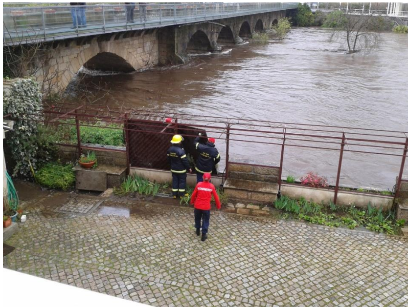
Fotografia 7 – Hotel Rural Vila do Banho (instalação das comportas da pégula)