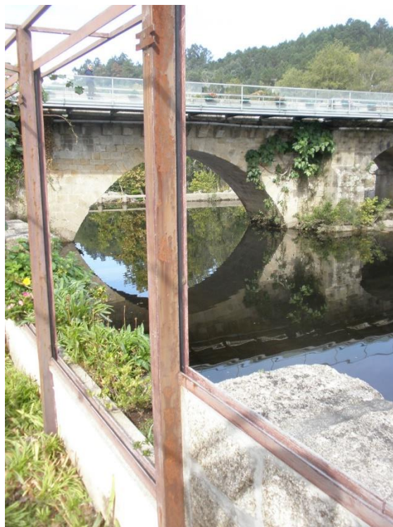
Fotografia 6 – Hotel Rural Vila do Banho (pormenor da pérgula)