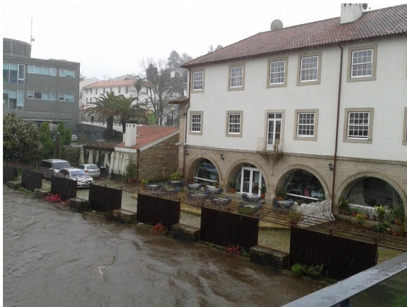
Fotografia 9 – Hotel Rural Vila do Banho (instalação das comportas da pérgula)