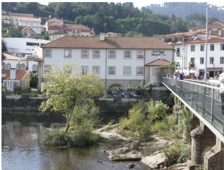
Fotografia 2 – Hotel Rural Vila do Banho (Alçado Posterior)