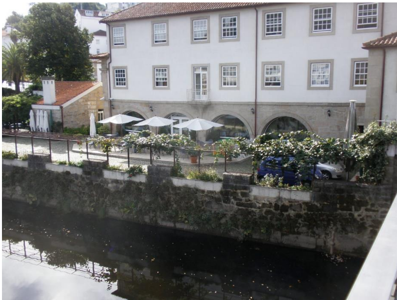
Fotografia 4 – Hotel Rural Vila do Banho (Alçado Posterior com Pérgula)