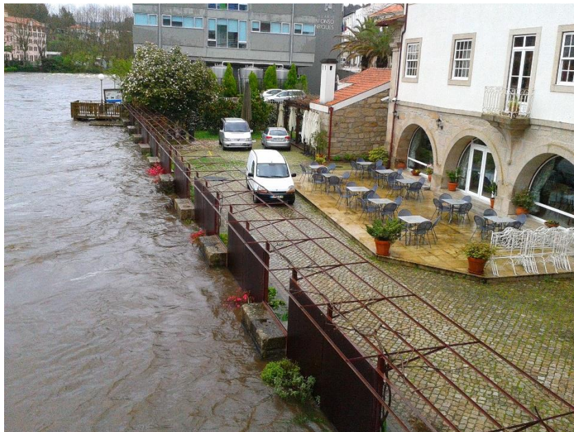
Fotografia 11 – Hotel Rural Vila do Banho (instalação das comportas da pérgula)