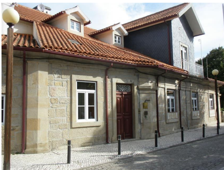
Fotografia 1 – Hotel Rural Vila do Banho (Alçado Principal)

Em finais dos anos 90 foi decidido recuperar uma construção existente à entrada de S. Pedro do Sul para aí instalar um Hotel Rural (fotografias 1 e 2).