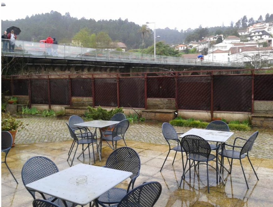
Fotografia 15 – Hotel Rural Vila do Banho (comportas da pérgula instaladas)

Na fotografia 15 pode observar-se a comporta completamente instalada, verificando-se a total eficácia da solução, que continuou a permitir a utilização da esplanada do logradouro apesar de os níveis no rio se localizarem a cerca de meia altura da referida pérgula.