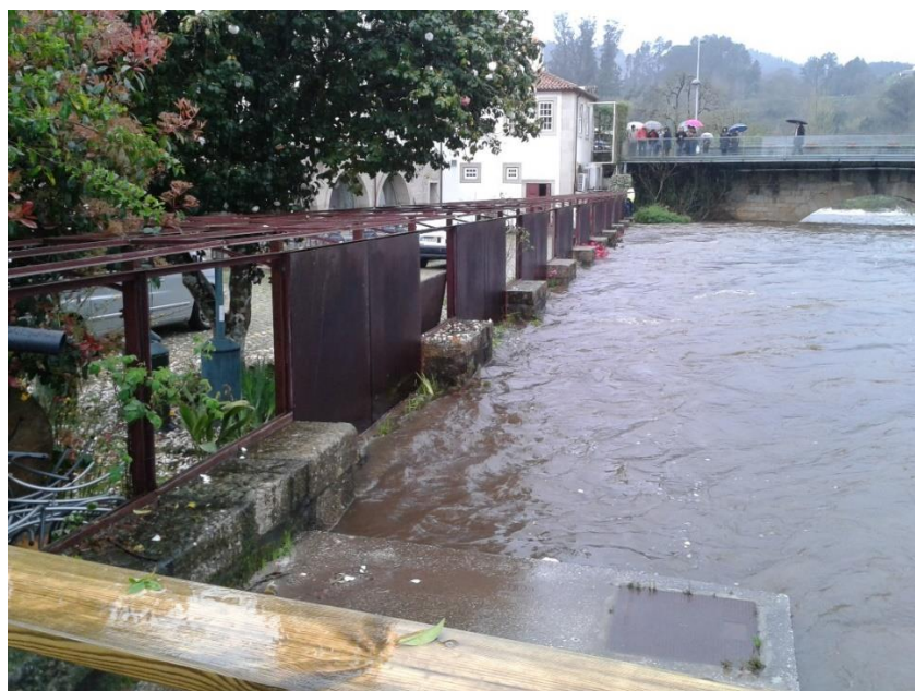
Fotografia 14 – Hotel Rural Vila do Banho (instalação das comportas da pégula)