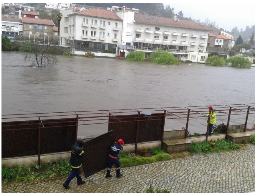
Fotografia 8 – Hotel Rural Vila do Banho (instalação das comportas da pégula)