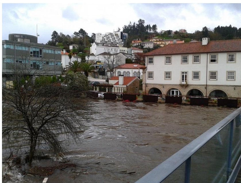
Fotografia 10 – Hotel Rural Vila do Banho (instalação das comportas da pérgula)