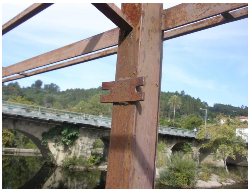
Fotografia 5 – Hotel Rural Vila do Banho (pormenor da pérgula)