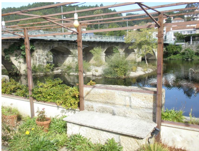
Fotografia 3 – Hotel Rural Vila do Banho (Pérgula)

Durante a construção (inverno 200/2001) verificou-se uma cheia excepcional cujo nível atingiu metade do piso térreo. Esta situação levou as proprietárias a procurarem uma solução para prevenir a ocorrência de situações análogas, tendo sido desenvolvido pelo Gabinete de Arquitetura João Eduardo Marta, Lda. uma pérgula no jardim das traseiras com uma solução de instalação rápida de comportas de contraplacado marítimo (fotografias 3, 4, 5 e 6).